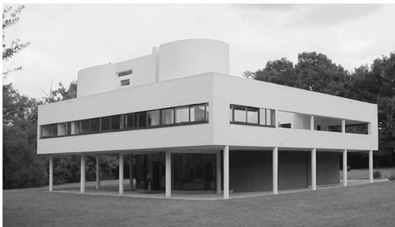
Villa Savoye en Poissy.

naturaleza material en un espacio y un tiempo que son reales. La construcción de Le Corbusier era una forma innovadora mientras que la de Venturi y Scott Brown constituye un sistema con resonancias tradicionales y modernas, con una relación más compleja con lo ordinario de pueda apreciarse en la Villa Savoye. La Lieb House no es algo cotidiano, es algo festivo, aunque con los pies en la tierra.