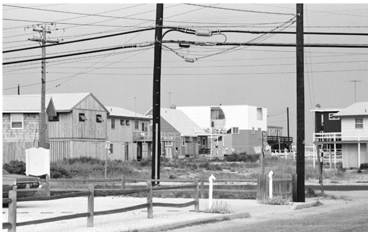
Lieb House, vista de la vivienda desde la calle de su primer emplazamiento.

¿Puede la arquitectura ser ordinaria? O, quizá, sería mejor preguntarse ¿cuál es su relación con lo ordinario? Para responder a ello debemos primero preguntarnos qué entendemos por tal cosa.