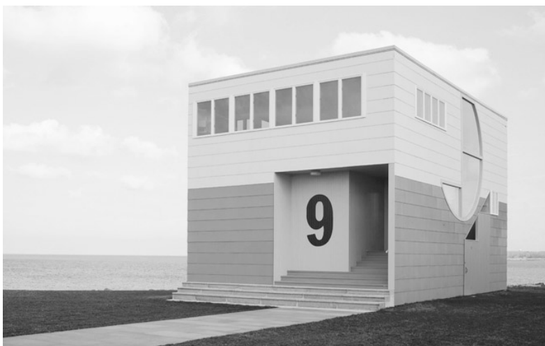
La Lieb House en el emplazamiento a donde fue llevada en 2009. Glen Cove, Nueva York.

A través de la “transfiguración de lo cotidiano”, en expresión de Arthur Danto, la arquitectura moderna pretendía tanto diseñar lo ordinario como mostrarlo. 18 En tal situación, mover la casa es un acto de fe para preservar la representación de lo ordinario. ¿Mover la Lieb House “retransfigura el tópico” (alterando la frase de Danto), convirtiendo lo ordinario en arte y redimiéndolo? Si así fuera, puede tratarse de un esfuerzo quijotesco ya que el final de la historia de Robinson supone para la familia la desaparición de la ordinaria vida hogareña de su pequeño pueblo, conforme desaparecen por el camino.